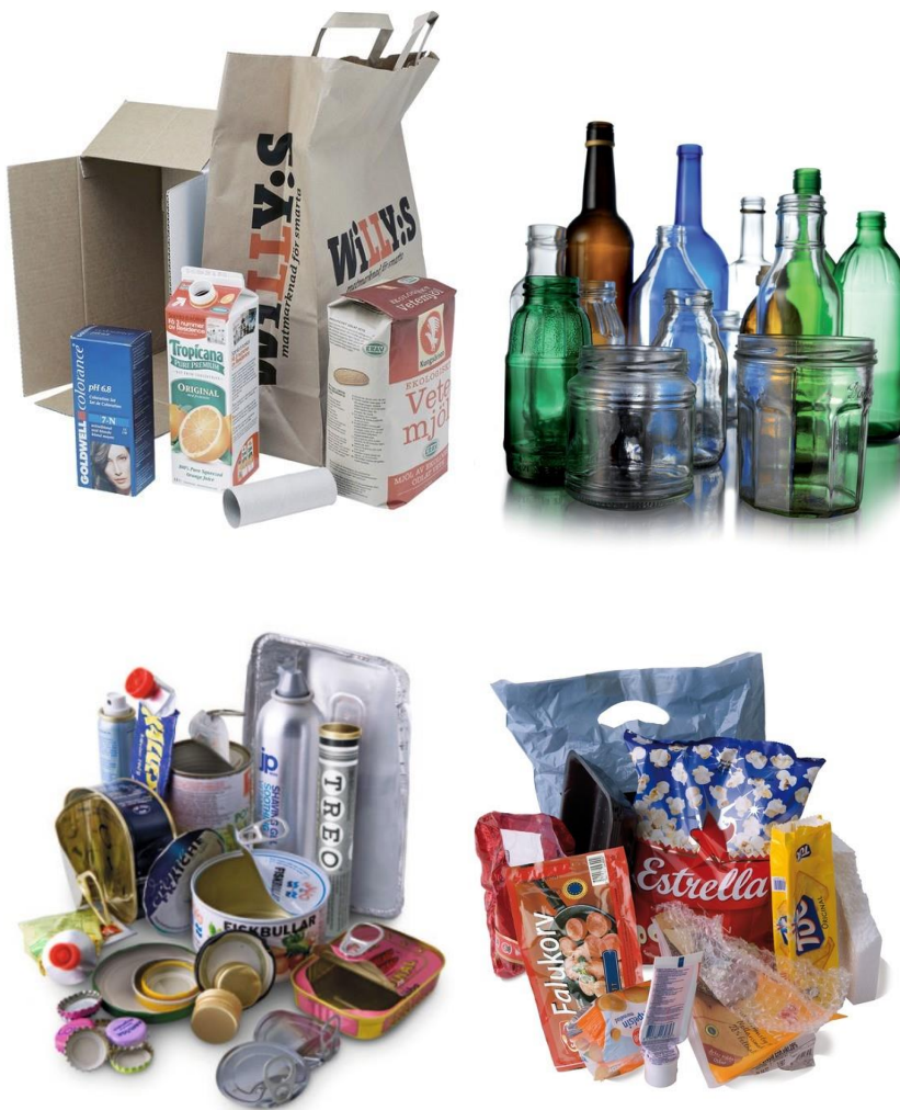
Figur 2. Återvinning i olika materials orter.

Det finns 22 inventerade gamla deponier i Ånge kommun varav ingen är i bruk. Här ingår även nedlagda slamlaguner. En undersökning gjordes 1984–85 och 1993, enligt Naturvårdsverkets förslag (Allmänna råd för avfallsplanering, SNV 91:1). Under åren 2003 och 2004 gjordes en ny inventering enligt ”Metodik för inventering av Förorenade områden – MIFO”. Resultatet från inventeringen visar att: 20 deponier har placerats i riskklass 4, och två deponier i riskklass 2. För de 20 deponierna i riskklass 4 har det bedömts att några åtgärder inte behöver vidtas. För en av de deponier som klassades i riskklass 2 - Svenskbyn, Alby - har deponier tillförts industriavfall i relativt stor omfattning, i vissa fall avfall som idag skulle klassas som farligt avfall. På denna deponi måste kompletterande undersökningar göras innan beslut fattas om nödvändiga avslutningsåtgärder. För den andra deponin, ”Kaffepannan”, har ”förslag till avslutningsplan” inlämnats till Länsstyrelsen i Västernorrlandslän 2003-06-26. Förslaget godkändes 2005-10-12. Under 2015 fonderades pengar för sluttäckningen av deponin.