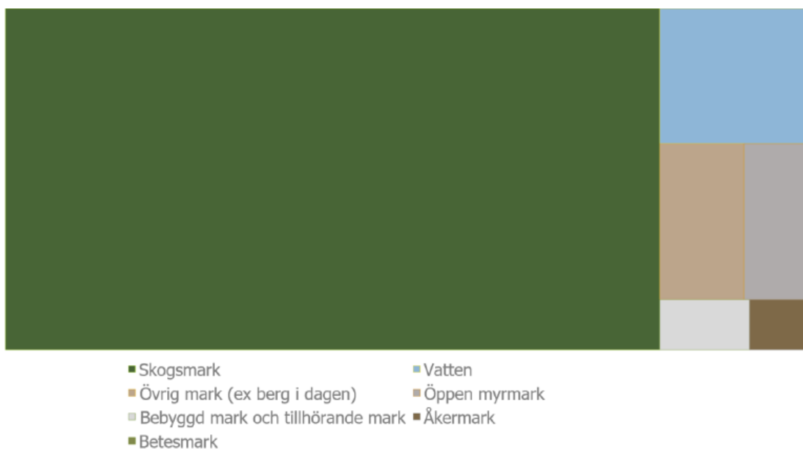
Figur 1: Kommunens landareal uppdelad på användning.

Ånge kommun består av en yta av 306 648 hektar. Markanvändningen på den här ytan är i huvudsak skogsmark. Resterande delar består av vatten, öppen myrmark och bebyggda områden enligt Ånge kommuns statistik från 2022 (Försörjningsbalans Ånge kommun). Jordbruksmarken i Ånge kommun är begränsad och odlar främst lokala grovfoderproduktion till nötkreatur. Det är en liten del av Ånges mark är aktiv odlingsmark, det huvudsakliga beståndet ligger utmed Ljungans dalgång.