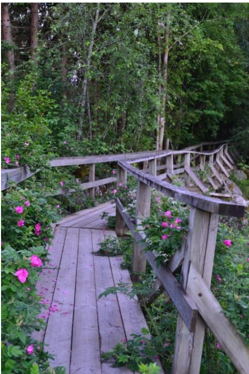
Figur 1: St. Olavs leden

”Besöksnäringen är inte en bransch utan består av delar från många branscher. Detta gör näringen unik och behovet av samarbete större”