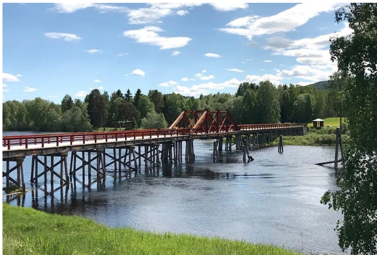
Figur 2: Vikbron

Social hållbarhet - En plats värd att besöka är en plats värd att bo på. Det finns flera lyckade exempel på platser där en stark besöksnäring lett till inflyttning, kvarstanning, ökad stolthet och förbättrade levnadsvillkor för platsen där man bor.