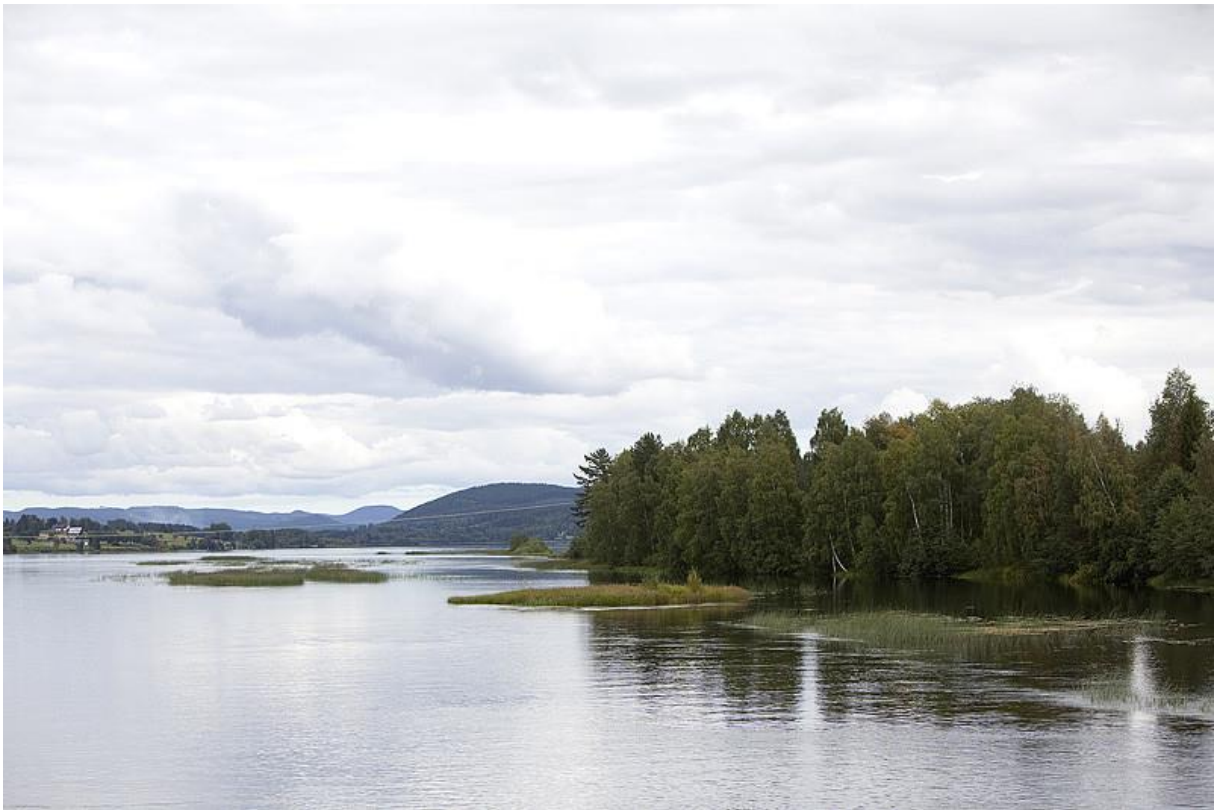
Figur 6. S:t Olavs leden Viknäset.

För att möjliggöra utveckling av besöksnäring, turism, kan kommunen i sin översiktsplan peka ut LIS-områden (Landsbygdsutveckling i strandnära lägen) där det redan finns pågående verksamhet med inriktning på besöksnäring eller där det bedöms finnas möjlighet till en sådan utveckling. Besöksnäringen har stor potential att utveckla landsbygden och områden för tex camping, konferensanläggningar, fiskecamp, restauranger och hotell mm. Inom dessa områden kan dispenskäl från strandskydd prövas för ett landsbygdsutvecklande syfte. Avsikten med områdena är att ge förbättrade möjligheter till åtgärder som ökar besöksnäringens konkurrenskraft och attraktivitet. Det ökar i sin tur förutsättningar för sysselsättning och service på orten och dess omgivning.