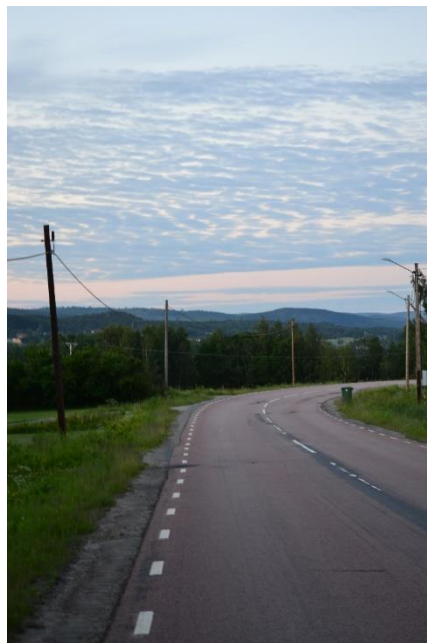
Figur 5: Väg vid vikbron.

Ånge stationshus som binder samman Norra stambanan och Mittbanan utgör en viktig knutpunkt för vidare resande inom kommunen. Viktiga transportstråk som passerar kommunen; E14, 83 och 315.