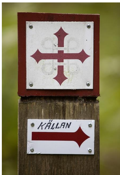
Figur 4: St. Olavs leden skyltning.

Ånges centralorter behöver även arbeta med att skapa fler lokaler för näringslivet. Verksamheter som skapar arbetstillfällen samt nya service och handelspunkter skapar attraktivare orter för såväl besökare som boende.