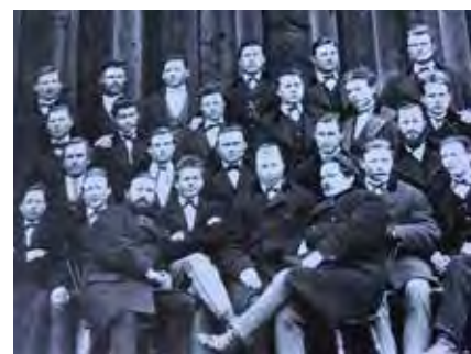
Första årskullen på Ålsta, 1873

Ålsta en plats där tradition och innovation möts, och där varje elev har möjlighet att växa, inte bara som lärande individ utan som aktiv deltagare i det större sammanhanget. Det är i detta gränsland mellan arv och framtida strävanden som Ålsta folkhögskola verkligen blomstrar, redo att skriva nästa kapitel i sin långa och anrika historia. ☺