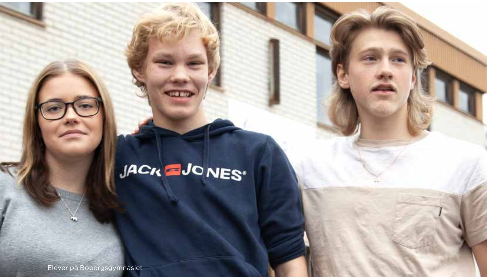
Elever på Bobergsgymnasiet

"Det är inte bara betygen", fortsätter han. "Det är en fråga om att ge eleverna verktyg och erfarenheter som gör dem anställningsbara direkt efter gymnasiet. Därför är praktiska moment så som 15 veckors praktik en central del av utbildningen." I det sammanhanget betonar Per det breda