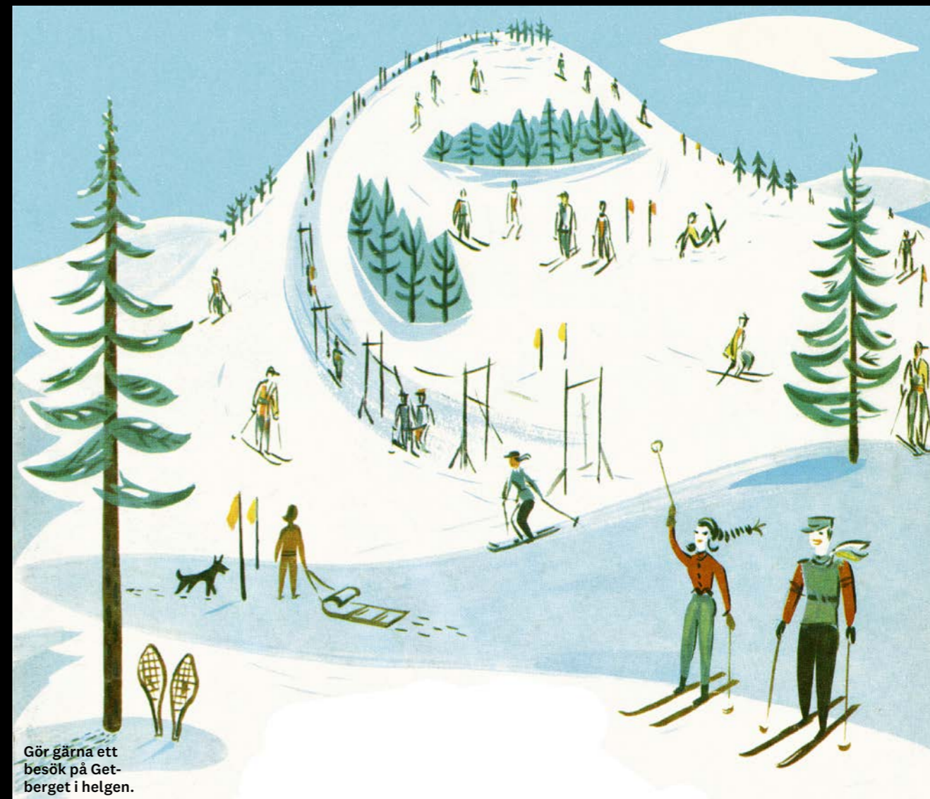
Gör gärna ett besök på Getberget i helgen.