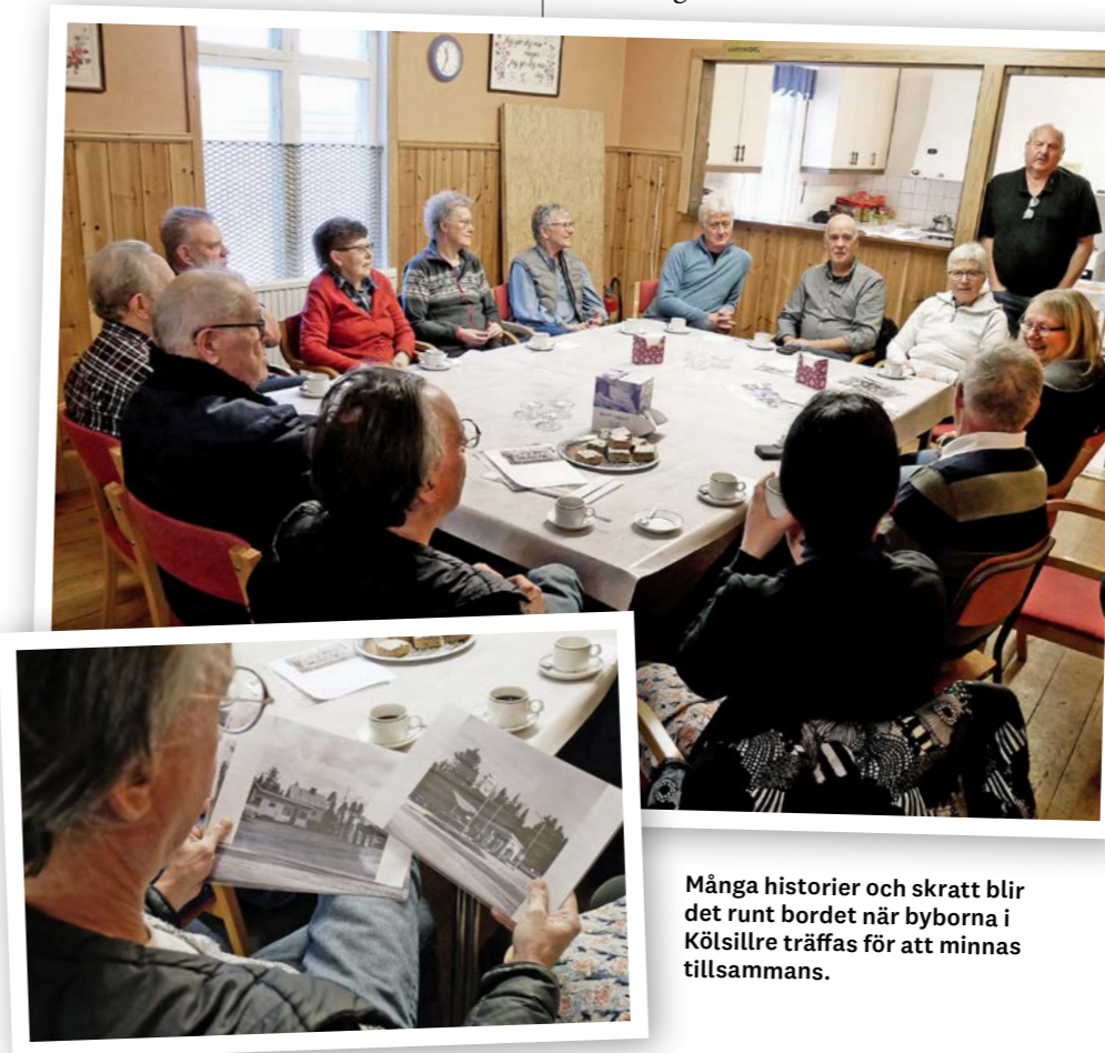
Många historier och skratt blir det runt bordet när byborna i Kölsillre träffas för att minnas tillsammans.