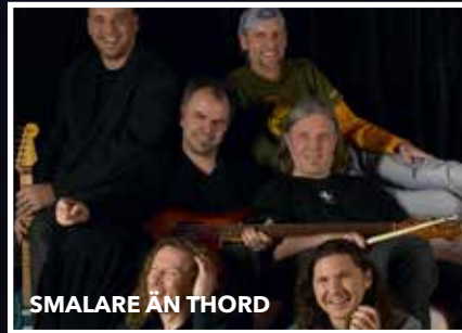
SMALARE ÄN THORD