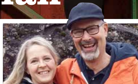
Livet bland ostar och får