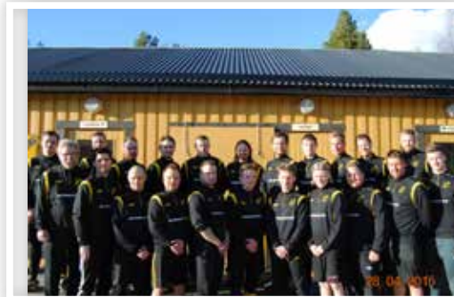
Ljunga IFs A-lag i fotboll, årgång 2015. Laget spelar i division 5 i Medelpad.