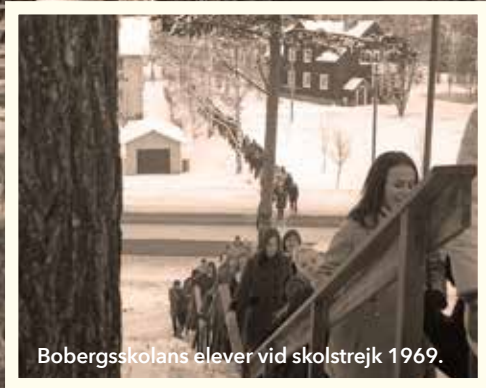
Bobergsskolans elever vid skolstrejk 1969.