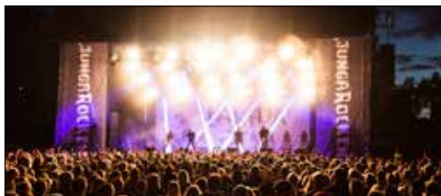
Ljungarocken har återvänt