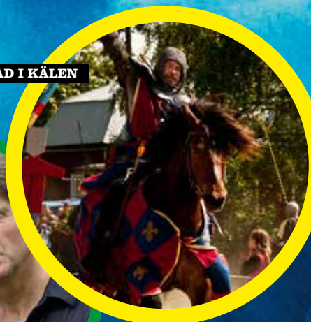
MEDELTIDSMARKNAD I KÅLEN