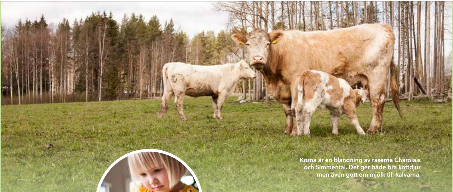
Korna är en blandning av raserna Charolais och Simmental. Det ger både bra köttjur men även gott om mjölk till kalvarna.