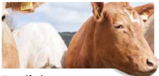
Ett riktigt gott liv