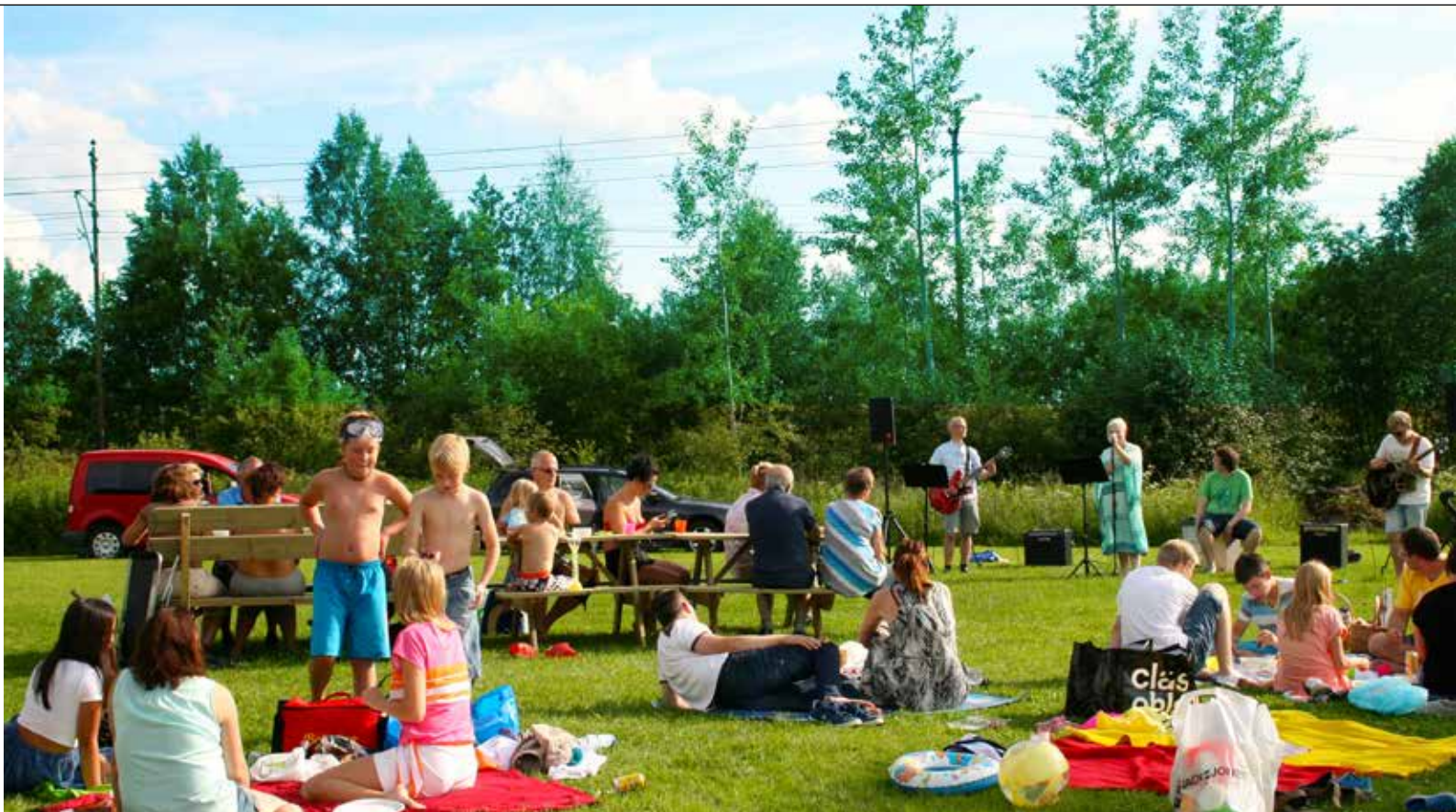
Förra sommarens familjekväll med grillning och underhållning.