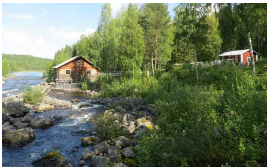
Tullkvarnen och mjölnarbostaden, Haverö Strömmar

MER INFO: visitjungandalen.com och stolavsleden.com