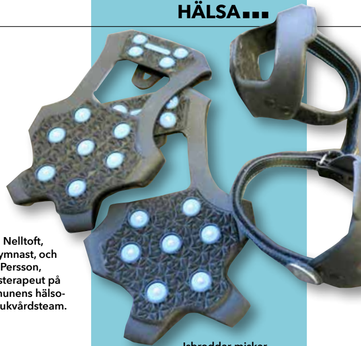
Isbroddar minskar risken att halka.