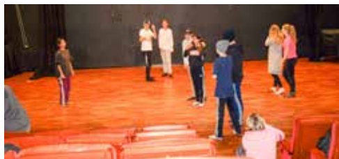
Modern dans med Minervaskolan