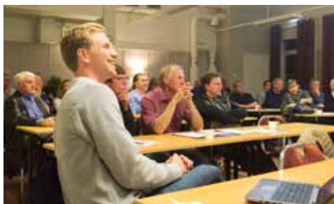
Många var intresserade av möjligheten att starta boende för pilgrimsvandrare och turister.

Den 4 oktober hölls det en informations- och inspirationsträff på Ålsta folkhögskola om hur man kan starta boende för pilgrimsvandrare. Men först en kort bakgrund till vad S:t Olavsleden är.