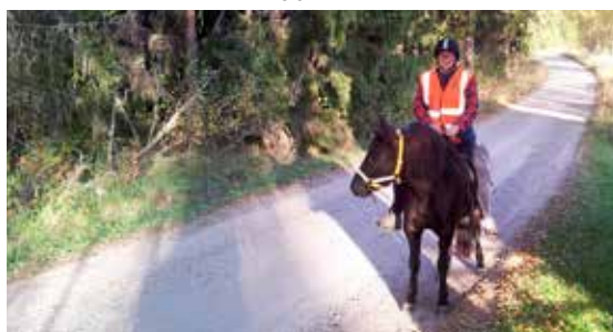
... och ridit i gränsmarkerna mot Jämtland.