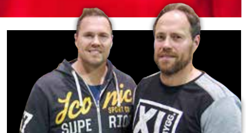
BRÖDER MED STARK FRAMTIDSTRO