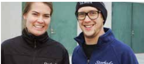
DE FANN DRÖMGÅRDEN I STORBODA