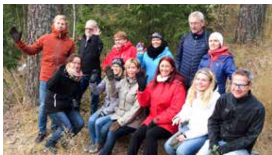
Hon har vandrat med grupper ...